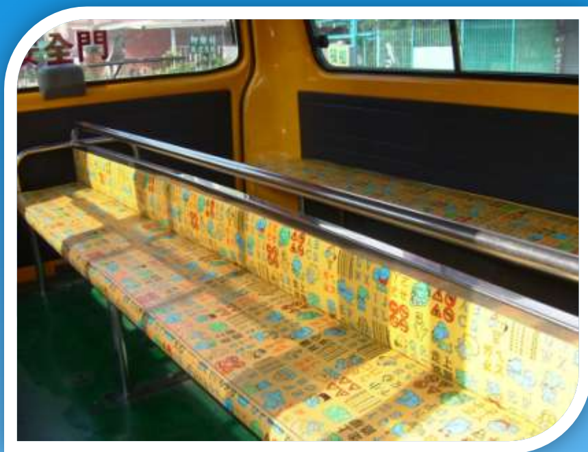
幼童專用車變更座椅。