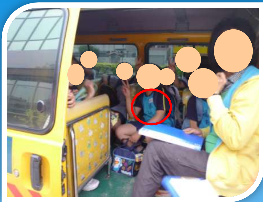
幼童專用車載送國小學童。