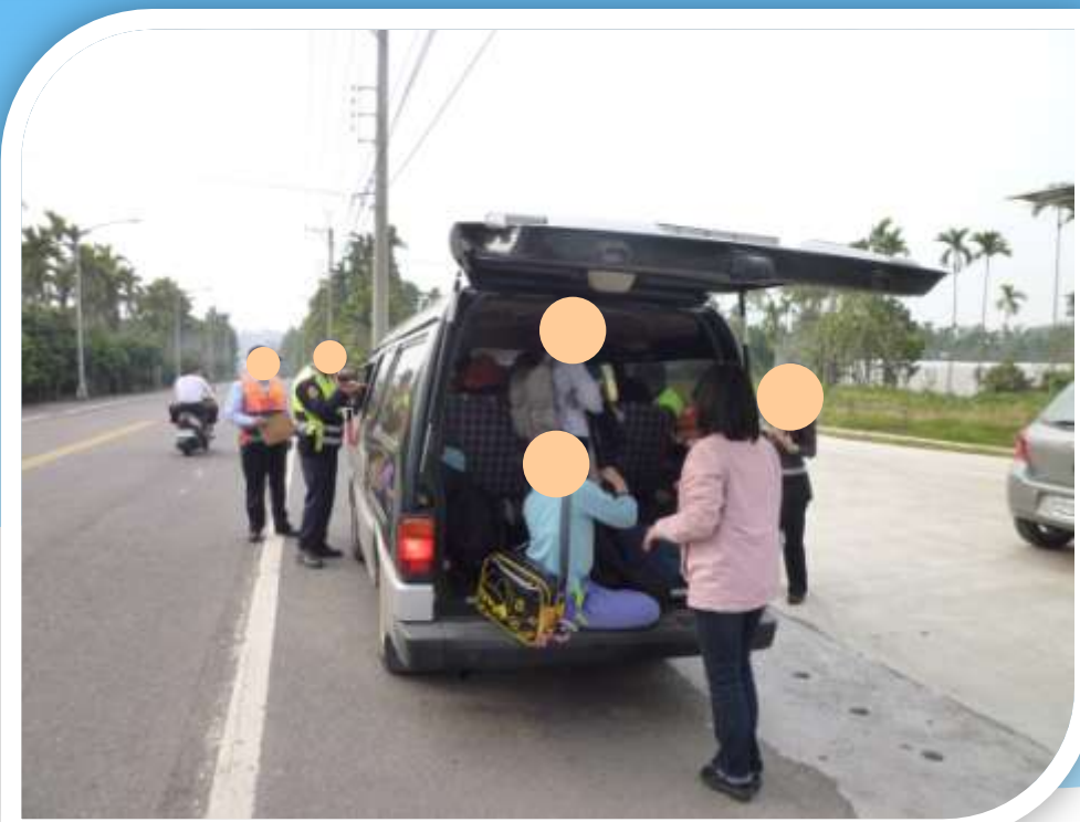
乘載人數超過核定人數。